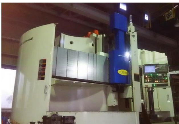
TUE-200 最大積載質量 15t