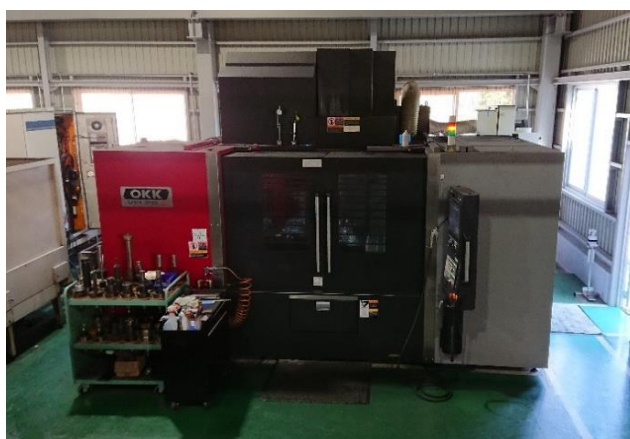
VM76R 最大積載質量 3t