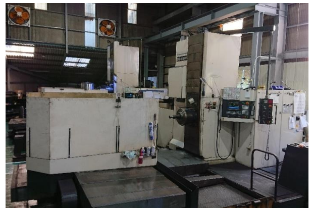
BTD-110H.R16 最大積載質量 6.3t