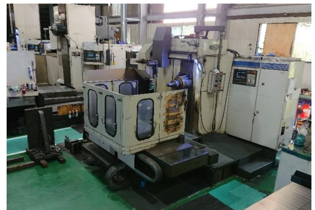
BTD-200QE 最大積載質量 3t