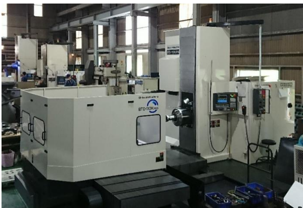
BTD-110.R16 最大積載質量 6.3t