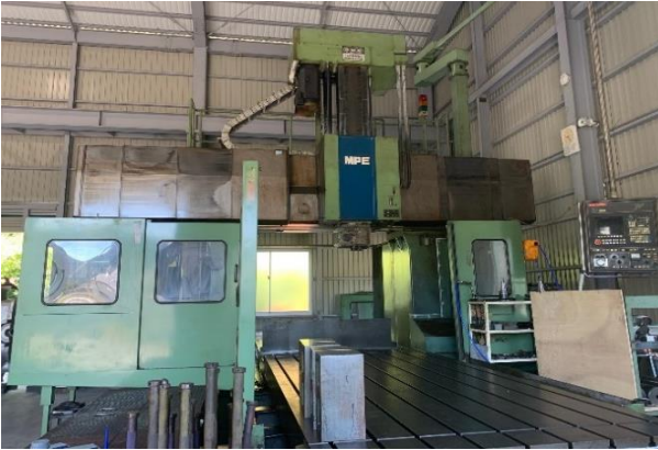
MPE-2140 (5H) 最大積載質量 20t