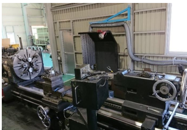
20尺 最大積載質量 6t