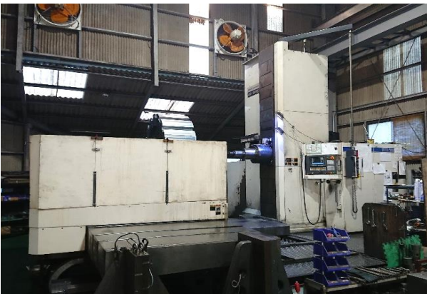
BTD-13F.R22 最大積載質量 10t