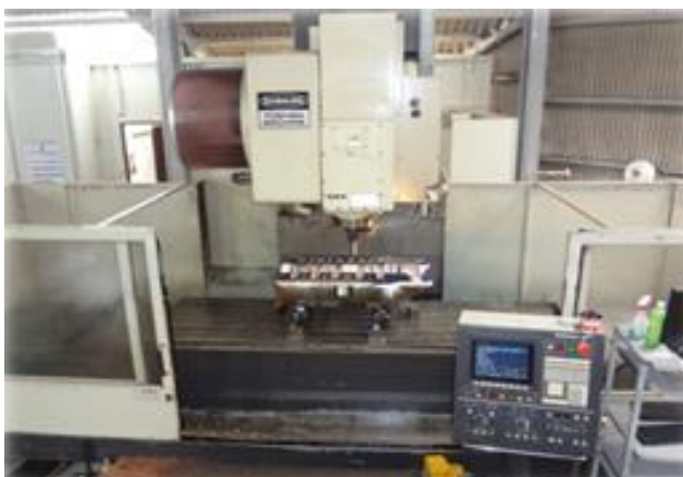
VMC-85E 最大積載質量 3t