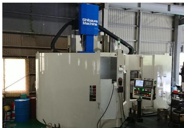
TUE-200(S) 最大積載質量 15t