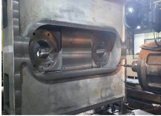
① 素材の粗加工 (スライド加工作業)