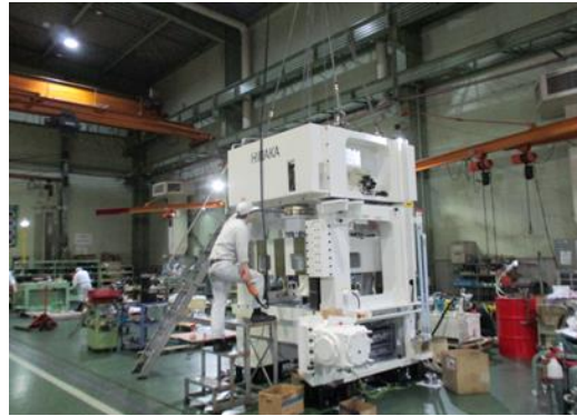
⑥ 本組み (三段組み作業)