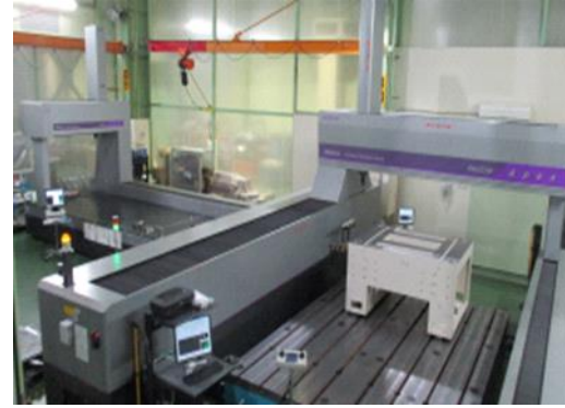
③ 三次元検査 (BED検査作業)