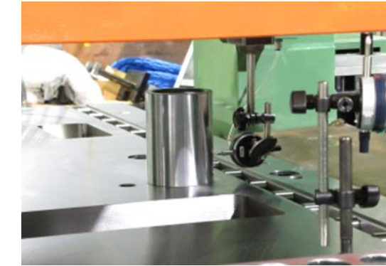
⑧ 運転調整 (直角調整作業)