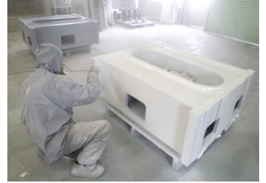
④ 塗装 (社内外注)