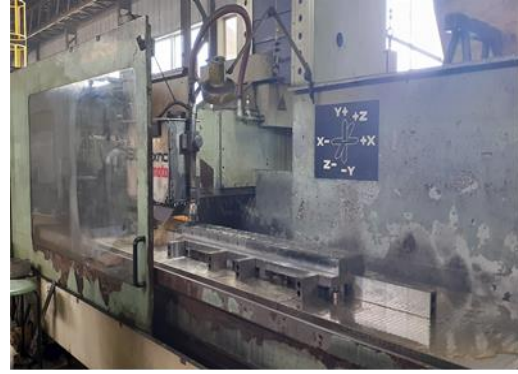
② 仕上げ加工 (ギブ研磨作業)