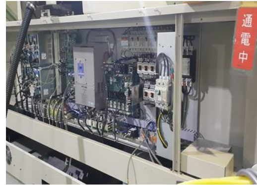
⑦ 電気配線 (社内外注)